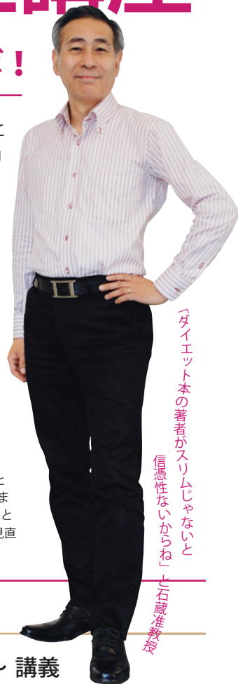
「ダイエット本の著者がスリムじゃないと、信憑性ないからね」と石蔵准教授

前半の講義では、生き生きと輝く積極的な男性でいるための、意識改革をレクチャーします。